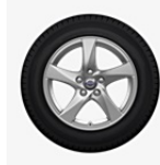
Leichtmetallräder HERA 7,0 x 16"