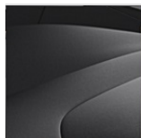
Polsterung: Anthrazit | Innendesign: Anthrazit | Dachhimmel: Quarz Grau