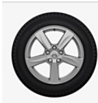
Leichtmetallräder MATRES 7,0 x 16"