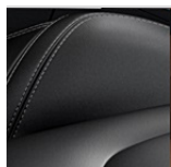
Polsterung: Anthrazit | Innen: Anthrazit | Dachhimmel: Anthrazit