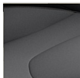
Polsterung: Anthrazit | Innendesign: Anthrazit | Dachhimmel: Quarz Grau