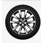
Leichtmetallräder RODINIA Diamantschnitt/Glanz-Schwarz 7,0 x 17"