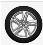
Leichtmetallräder SADIA 8,0 x 17"