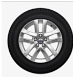
Leichtmetallräder PANGAEA 7,0 x 16"