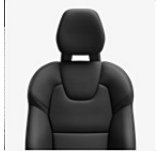
Polsterung: Anthrazit | Innen: Anthrazit | Teppich: Anthrazit