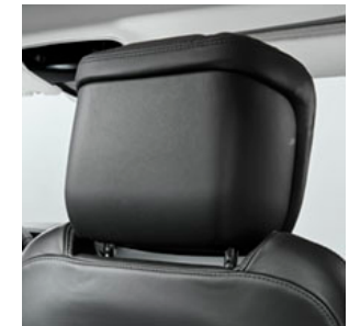
MULTIMEDIASYSTEM IM FOND