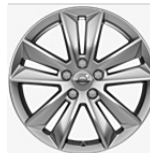
17" Leichtmetallräder 5-Doppelspeichen-Design mit Bereifung 225/50 R17