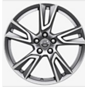
18"-Leichtmetallräder 5-Doppelspeichen-Design CROSS COUNTRY