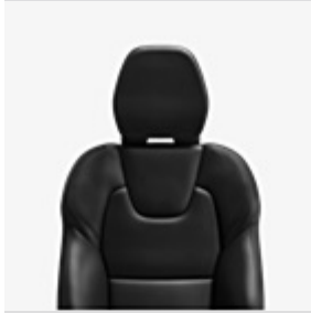
RA02: Polsterung: Anthrazit | Innendesign: Anthrazit | Teppich: Anthrazit | Dachhimmel: Hell Beige