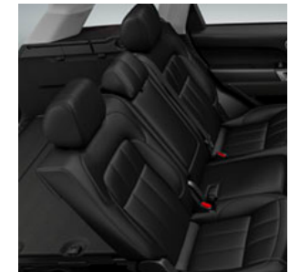
3. SITZREIHE MIT 2 SITZEN