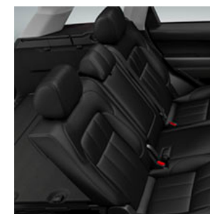
3. SITZREIHE MIT 2 SITZEN