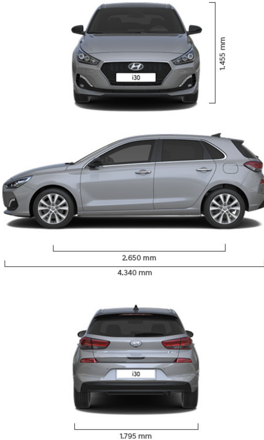
Abbildung ist als unverbindlich zu betrachten und stellt eine annähernde Beschreibung dar. Fahrzeugabbildungen enthalten z. T. aufpreispflichtige Sonderausstattungen.