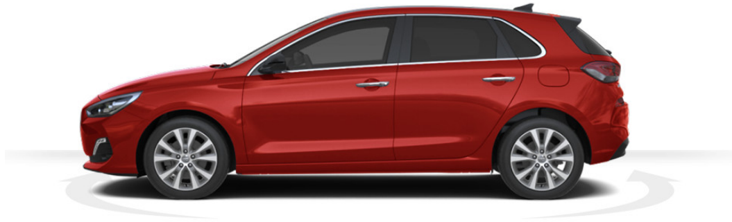
Abbildung ist als unverbindlich zu betrachten und stellt eine annähernde Beschreibung dar. Fahrzeugabbildungen enthalten z. T. aufpreispflichtige Sonderausstattungen.