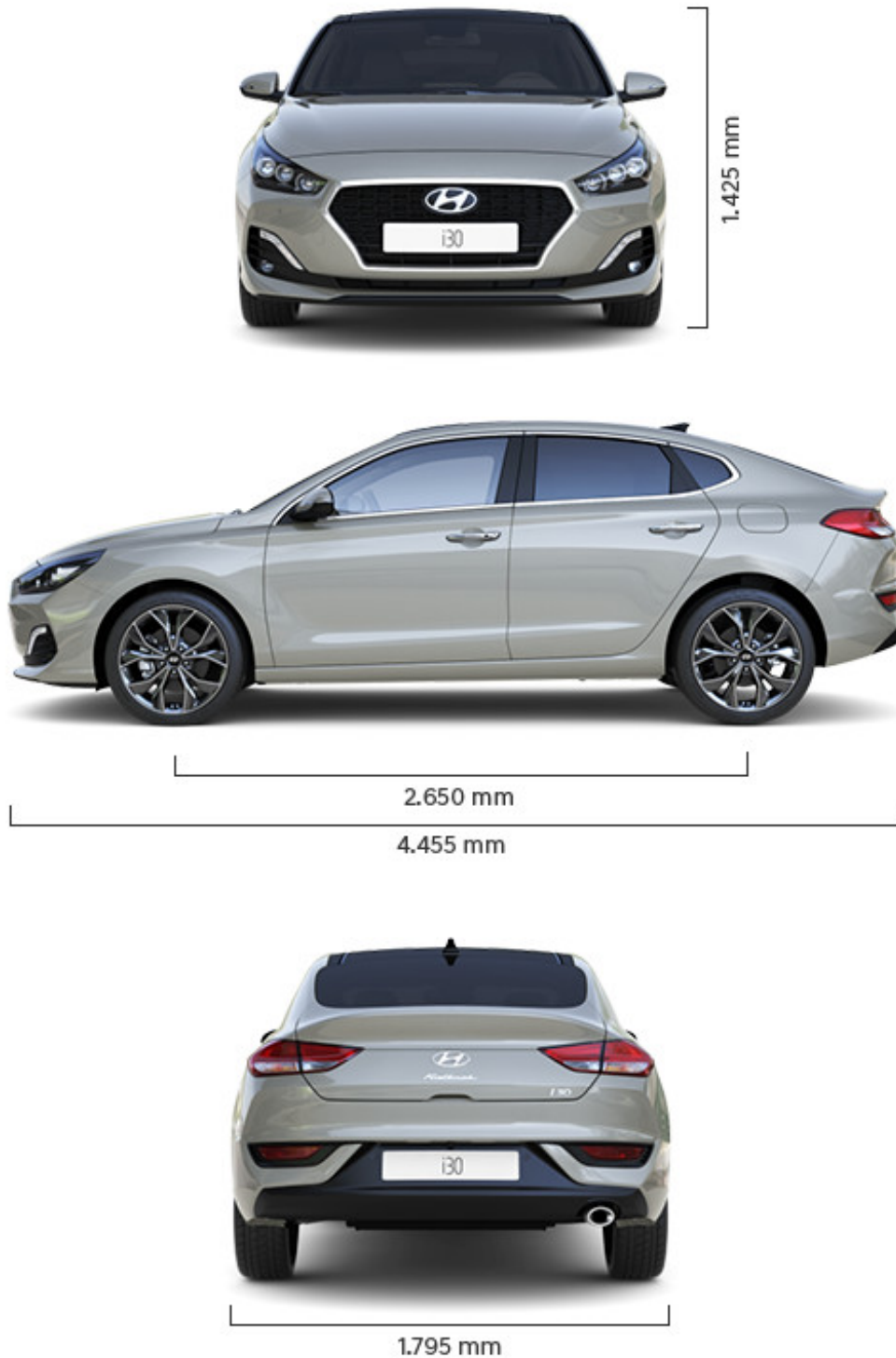
Abbildung ist als unverbindlich zu betrachten und stellt eine annähernde Beschreibung dar. Fahrzeugabbildungen enthalten z. T. aufpreispflichtige Sonderausstattungen.