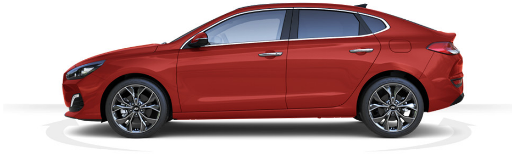
Abbildung ist als unverbindlich zu betrachten und stellt eine annähernde Beschreibung dar. Fahrzeugabbildungen enthalten z. T. aufpreispflichtige Sonderausstattungen.