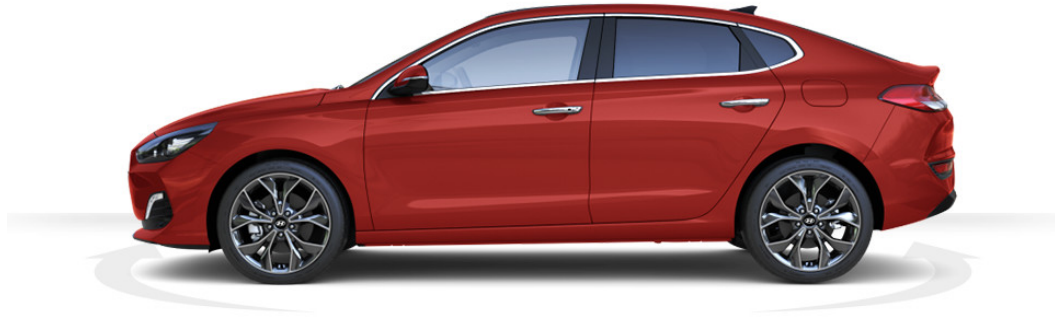
Abbildung ist als unverbindlich zu betrachten und stellt eine annähernde Beschreibung dar. Fahrzeugabbildungen enthalten z. T. aufpreispflichtige Sonderausstattungen.