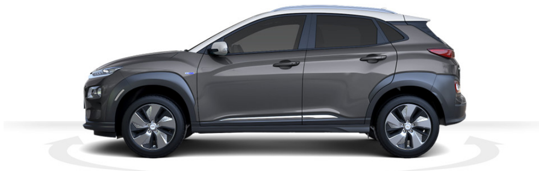
Abbildung ist als unverbindlich zu betrachten und stellt eine annähernde Beschreibung dar. Fahrzeugabbildungen enthalten z. T. aufpreispflichtige Sonderausstattungen.