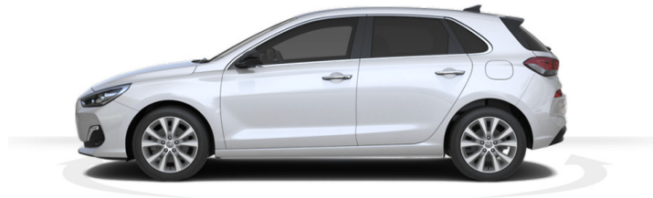
Abbildung ist als unverbindlich zu betrachten und stellt eine annähernde Beschreibung dar. Fahrzeugabbildungen enthalten z. T. aufpreispflichtige Sonderausstattungen.