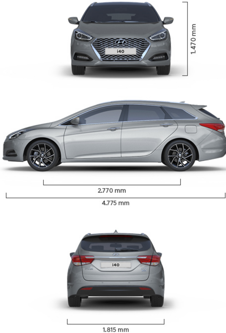
Abbildung ist als unverbindlich zu betrachten und stellt eine annähernde Beschreibung dar. Fahrzeugabbildungen enthalten z. T. aufpreispflichtige Sonderausstattungen.