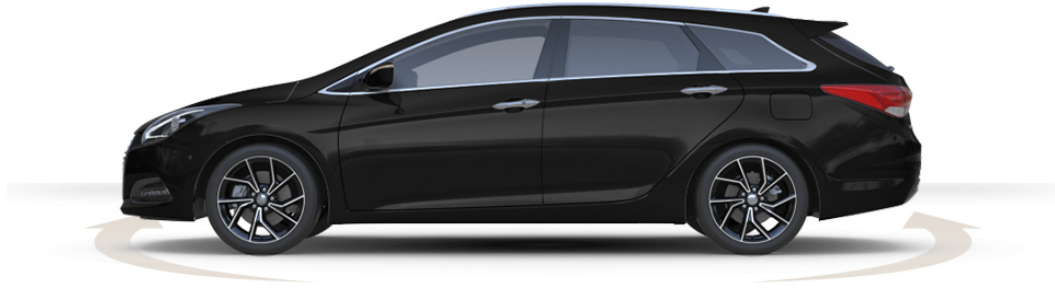
Abbildung ist als unverbindlich zu betrachten und stellt eine annähernde Beschreibung dar. Fahrzeugabbildungen enthalten z. T. aufpreispflichtige Sonderausstattungen.