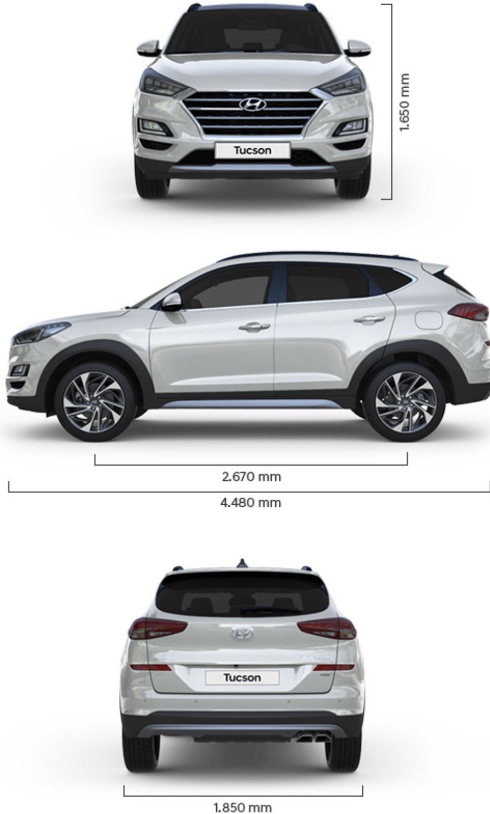
Abbildung ist als unverbindlich zu betrachten und stellt eine annähernde Beschreibung dar. Fahrzeugabbildungen enthalten z. T. aufpreispflichtige Sonderausstattungen.