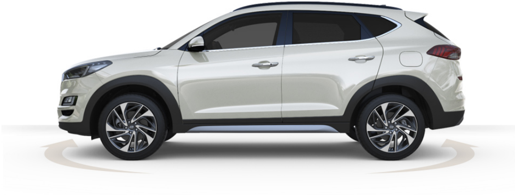
Abbildung ist als unverbindlich zu betrachten und stellt eine annähernde Beschreibung dar. Fahrzeugabbildungen enthalten z. T. aufpreispflichtige Sonderausstattungen.