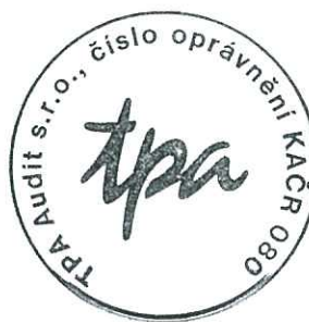
TPA Audit s.r.o. Antala Staška 2027/79, Praha 4 číslo oprávnění 080 KAČR