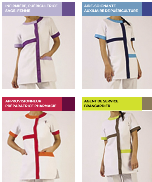
Une équipe à votre écoute

Différentes catégories de professionnels participent à votre prise en charge. Chaque fonction se distingue par un code couleur repérable sur les tenues ou par leur badge.