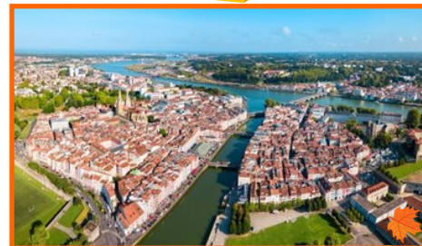
Vue de haut