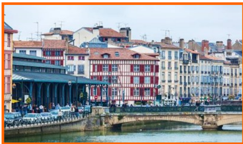
Sur les berges de Nive.

Bayonne est située à moins de 20 minutes de la plage si vous souhaitez vous baigner dans l' Océan Atlantique .