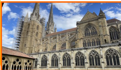
Cathédrale Sainte Marie