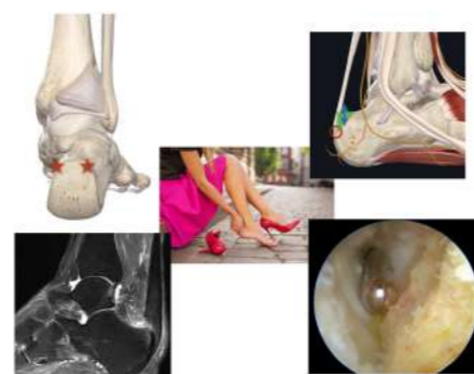
Résection endoscopique tendinopathie d'Achille d'insertion

+/- une réinsertion du tendon. Ici aussi le traitement sous endoscopie (caméra) apportera les mêmes avantages.