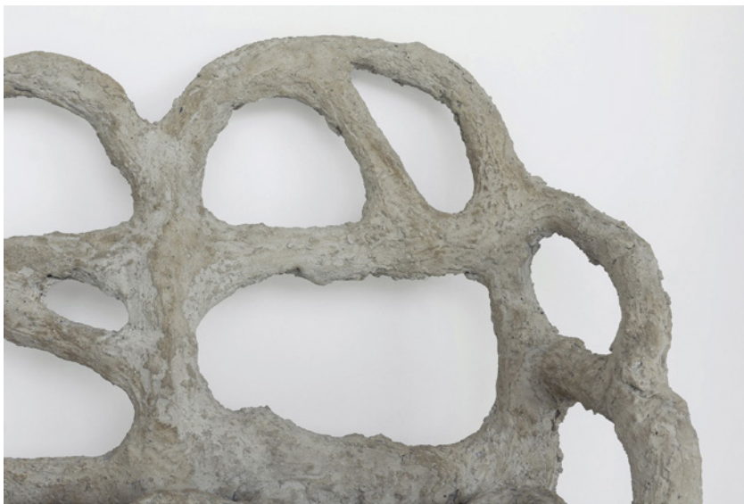
Tom Castinel, Sans titre , détail, 2023