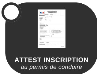
ATTEST INSCRIPTION au permis de conduire