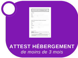
ATTEST HÉBERGEMENT de moins de 3 mois