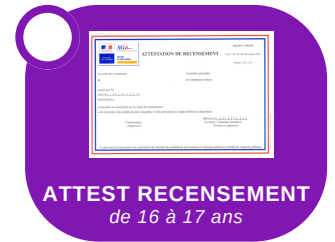
ATTEST RECENSEMENT de 16 à 17 ans