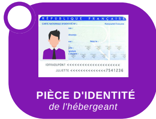
PIÈCE D'IDENTITÉ de l'hébergeant