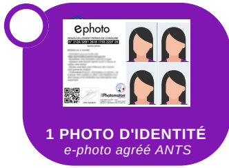
1 PHOTO D'IDENTITÉ e-photo agréé ANTS