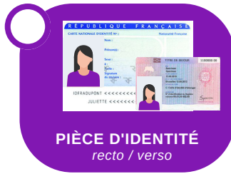
PIÈCE D'IDENTITÉ recto / verso