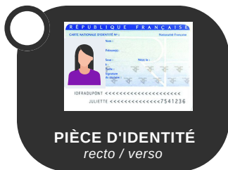
PIÈCE D'IDENTITÉ recto / verso