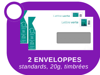
2 ENVELOPPES standards, 20g, timbrées