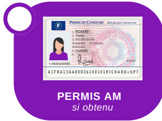
PERMIS AM si obtenu