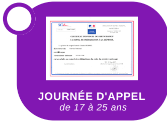
JOURNÉE D'APPEL de 17 à 25 ans