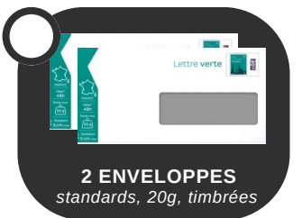
2 ENVELOPPES standards, 20g, timbrées