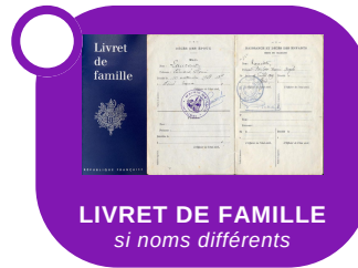
LIVRET DE FAMILLE si noms différents