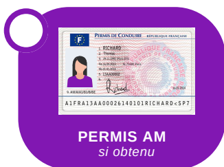
PERMIS AM si obtenu