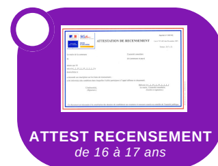
ATTEST RECENSEMENT de 16 à 17 ans