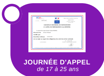
JOURNÉE D'APPEL de 17 à 25 ans