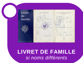
LIVRET DE FAMILLE si noms différents