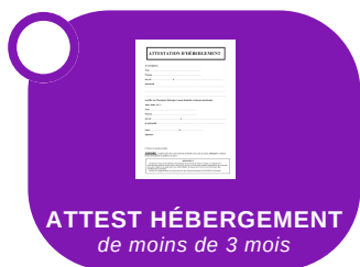
ATTEST HÉBERGEMENT de moins de 3 mois