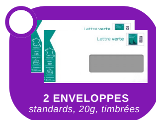
2 ENVELOPPES standards, 20g, timbrées