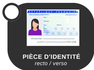
PIÈCE D'IDENTITÉ recto / verso