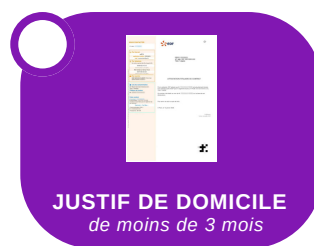
JUSTIF DE DOMICILE de moins de 3 mois