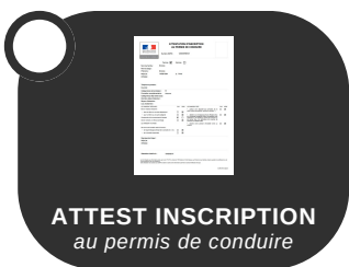
ATTEST INSCRIPTION au permis de conduire