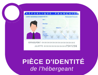
PIÈCE D'IDENTITÉ de l'hébergeant