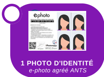
1 PHOTO D'IDENTITÉ e-photo agréé ANTS