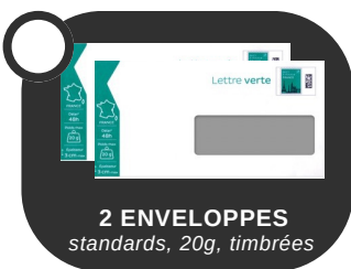
2 ENVELOPPES standards, 20g, timbrées