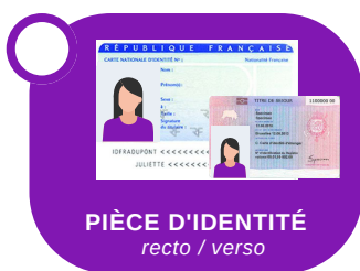
PIÈCE D'IDENTITÉ recto / verso