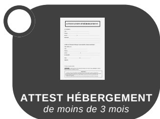
ATTEST HÉBERGEMENT de moins de 3 mois