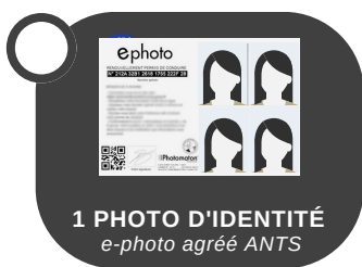
1 PHOTO D'IDENTITÉ e-photo agréé ANTS