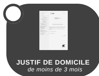
JUSTIF DE DOMICILE de moins de 3 mois