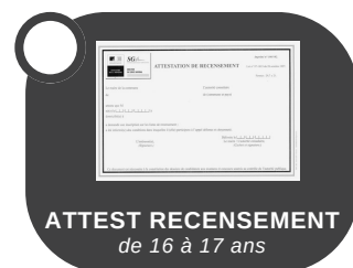
ATTEST RECENSEMENT de 16 à 17 ans