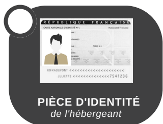
PIÈCE D'IDENTITÉ de l'hébergeant