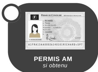
PERMIS AM si obtenu