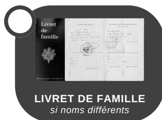
LIVRET DE FAMILLE si noms différents