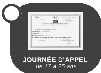
JOURNÉE D'APPEL de 17 à 25 ans