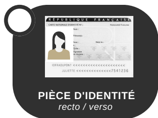
PIÈCE D'IDENTITÉ recto / verso