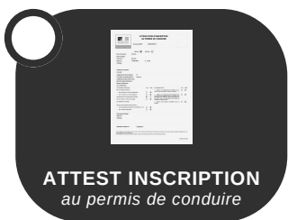
ATTEST INSCRIPTION au permis de conduire