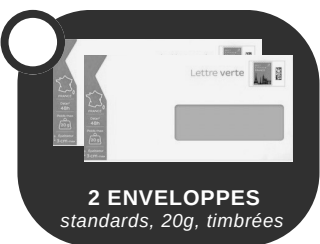
2 ENVELOPPES standards, 20g, timbrées