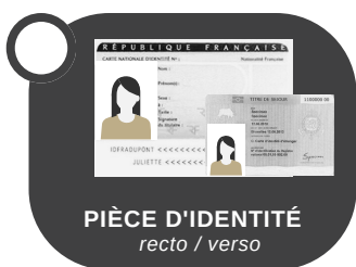
PIÈCE D'IDENTITÉ recto / verso