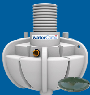
2,3 m 3 3-kammarbrunn självfall