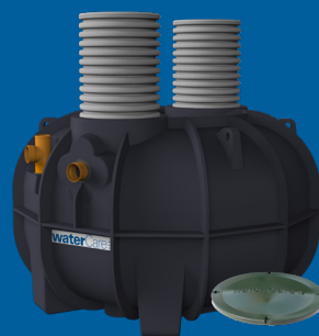
3,0 m 3 3-kammarbrunn självfall