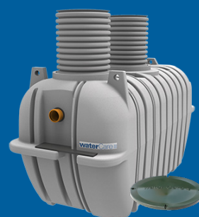
4,0 m 3 3-kammarbrunn självfall