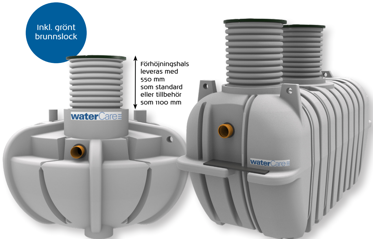
Slamavskiljare självfall för 1 hushåll (5 PE)

Avloppsanläggning för enskilda hushåll, samfälligheter och övriga verksamheter