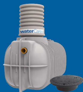
2,5 m 3 3-kammarbrunn självfall