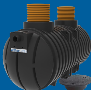
6,0 m 3 3-kammarbrunn självfall (15PE)