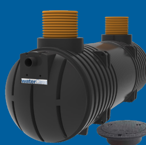
10,0 m 3 3-kammarbrunn självfall (25PE)