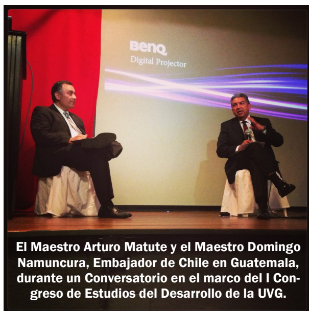
El Maestro Arturo Matute y el Maestro Domingo Namuncura, Embajador de Chile en Guatemala, durante un Conversatorio en el marco del I Congreso de Estudios del Desarrollo de la UVG.

Miembros de la Facultad tuvieron destacadas participaciones a través de ponencias, talleres y mesas redondas en los siguientes eventos nacionales: