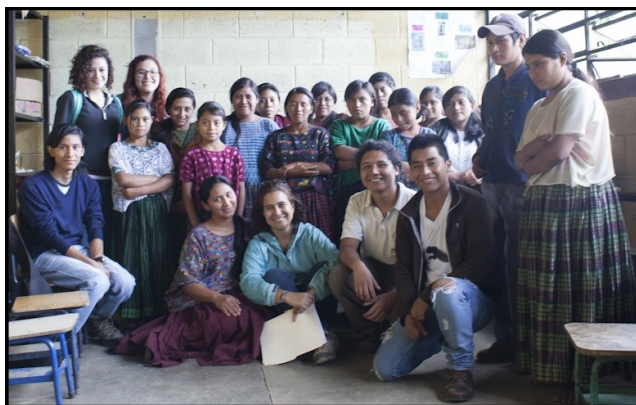
Estudiantes de Antropología y Sociología compartiendo con jóvenes de Tactic.