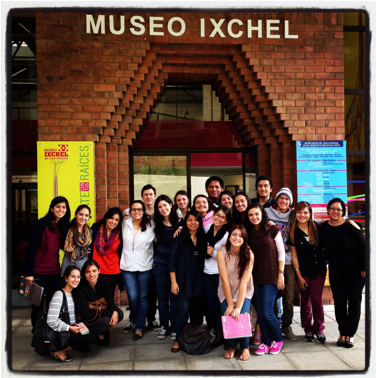
Algunos de los alumnos carné 2014 de Ciencias Sociales, durante la visita al Museo Ixchel del Traje Indígena, Curso de Antropología Cultural.