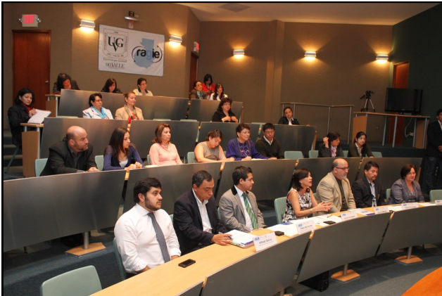
Firma de Convenio entre el Ministerio de Educación, la Universidad de la Laguna y la UVG para la ejecución del proyecto PRIMATE.

Además del ya mencionado proyecto Pimate (página 2), la Facultad ha dado pasos firmes hacia la innovación en temas digitales y tecnológicos a partir de una serie de iniciativas.