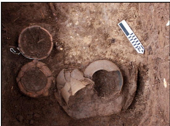
Ofrenda de la Estructura 12, Semetabaj

El proyecto Arqueológico Semetabaj tuvo grandes logros durante 2014, destacando la firma de un acuerdo de trabajo entre la Municipalidad de San Andrés Semetabaj, la Dirección General de Patrimonio Cultural y Natural y la UVG. Se descubrió además una ofrenda fechada en 300 a.C., una de las más antiguas de la región del Altiplano.