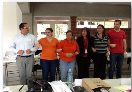
Alumnos del curso “Buenas prácticas para la docencia universitaria” de la Maestría en Gestión del Talento Humano.