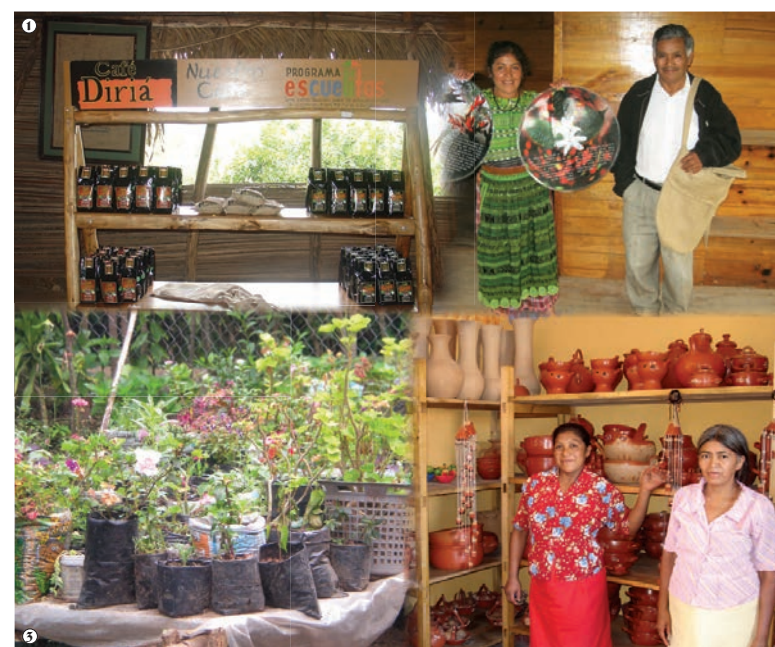
La diversificación económica con actividades complementarias al café ha tenido mucho éxito en varios sitios de la región. Algunos ejemplos interesantes es la promoción del agroturismo, con la implementación del tour de café (Diria Coffee Tour de Coopepilangosta, Hojancha, Costa Rica 1 y Tour de Café ASU-VIM, Sololá, Guatemala 2 ) y la creación de parques ecológicos (Parque Ecológico del Volcán San Pedro, Sololá, Guatemala). Otros ejemplos es la comercialización de flores en macetas (Grupo de mujeres de Bellavista, Cacahoatán, México 3 ), la elaboración de artesanías, como por ejemplo la alfarería (Micro Empresa Alfareras Lenca Pala, Lempira, Honduras 4 ), fabricación de textiles y artesanía en mostacilla (Asociación de Mujeres, Is Luna, Sololá, Guatemala).

La organización social , se reconoce como una de las estrategias más importantes para enfrentar los cambios globales, pero a su vez es una actividad de difícil ejecu-