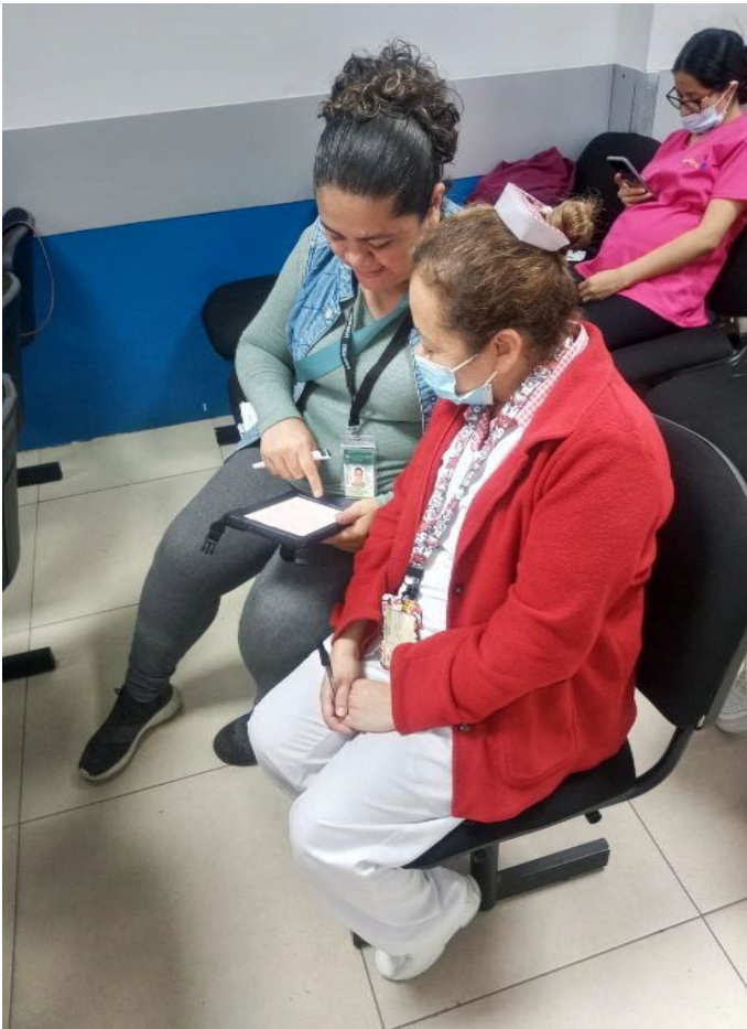
Enfermera del proyecto entrevistando a personal de salud en Ciudad de Guatemala.