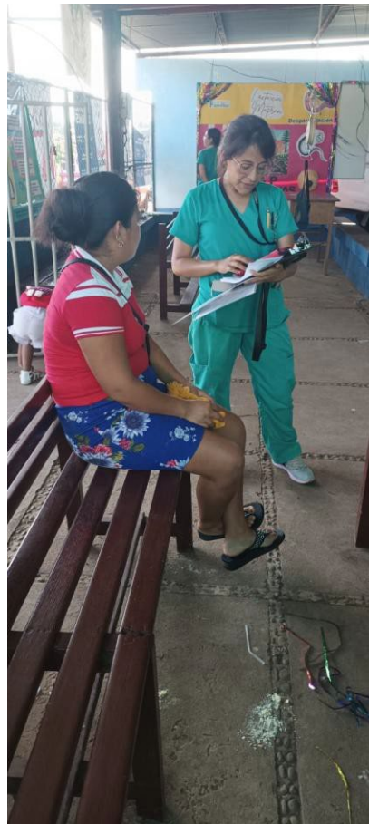
Personal del proyecto entrevistando embarazadas en Quetzaltenango, Guatemala