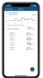
Individuelle Heizprofile über die kostenlose homematic IP App

Modell Kompakt: Maße (B x H x T): 51 x 98 x 48 mm, Art-Nr. 330310 | 83,89 €/St.