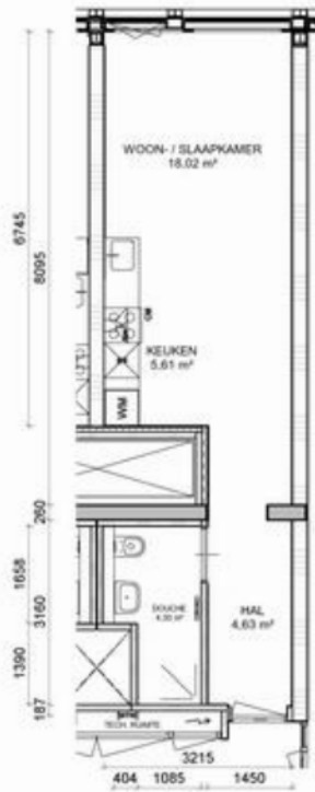
4e Verdieping SCHAAL 1 : 100