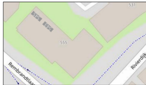
Begane grond (-1)