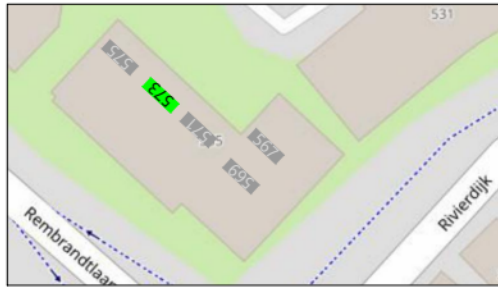
3e verdieping (2)