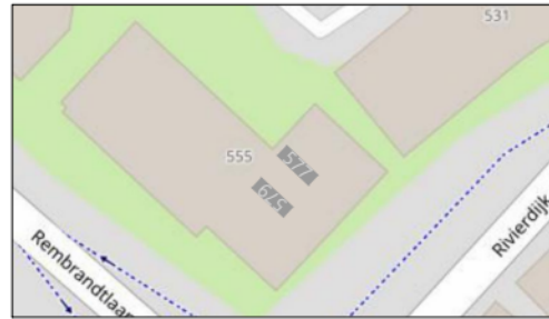
4e verdieping (3)