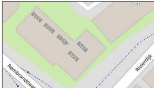
1e verdieping (0)