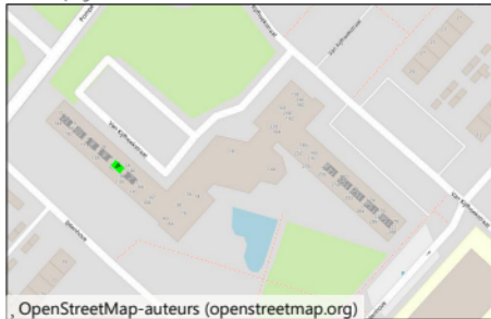
OpenStreetMap-auteurs (openstreetmap.org) Begane grond