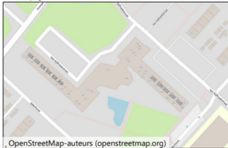
OpenStreetMap-auteurs (openstreetmap.org) Begane grond