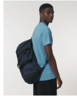
Lightweight Duffle Bag

Shell : Plain Weave , 100% recyceltes Polyester , Fluorine-free DWR , 75 GSM Lining : Taffeta , 100% recyceltes Polyester , 60 GSM