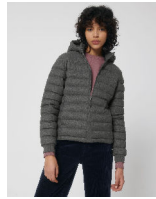
Stella Voyager Wool-Like

Shell : Plain Weave Brushed , 100% recyceltes Polyester , Fluorine-free DWR , 140 GSM