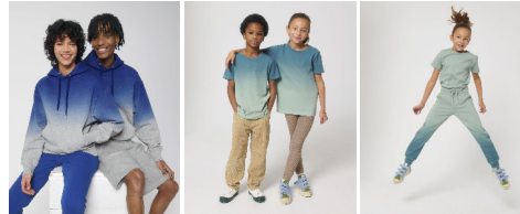
Slammer Dip Dye