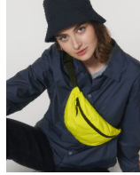
Lightweight Hip Bag

Shell : Plain Weave , 100% polyester recyclé , Fluorine-free DWR , 75 GSM