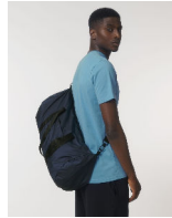
Lightweight Duffle Bag

Shell : Plain Weave , 100% poliestere riciclato , Fluorine-free DWR , 75 GSM