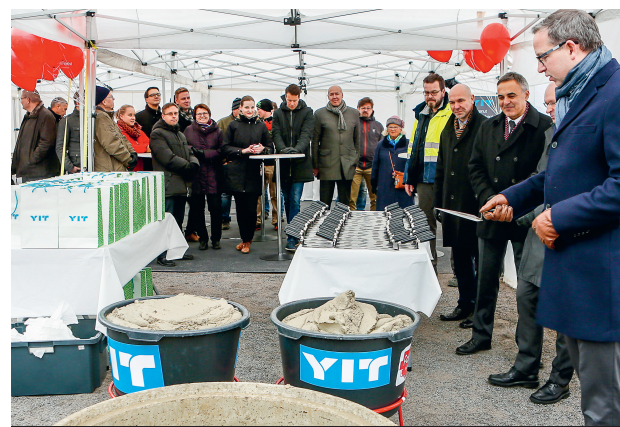
FABRIIKIN RAKENTAMINEN KÄYNNISTYI JUHLAVASTI 1.11.2016 PERUSKIVEN MUURAUKSELLA.

KILPAILUEHDOTUKSEN LAATINEESSA TYÖRYHMÄSSÄ OVAT MUKANA VR TRACK OY, C&J ARKKITEHDIT OY JA LIGHTING DESIGN COLLECTIVE OY.