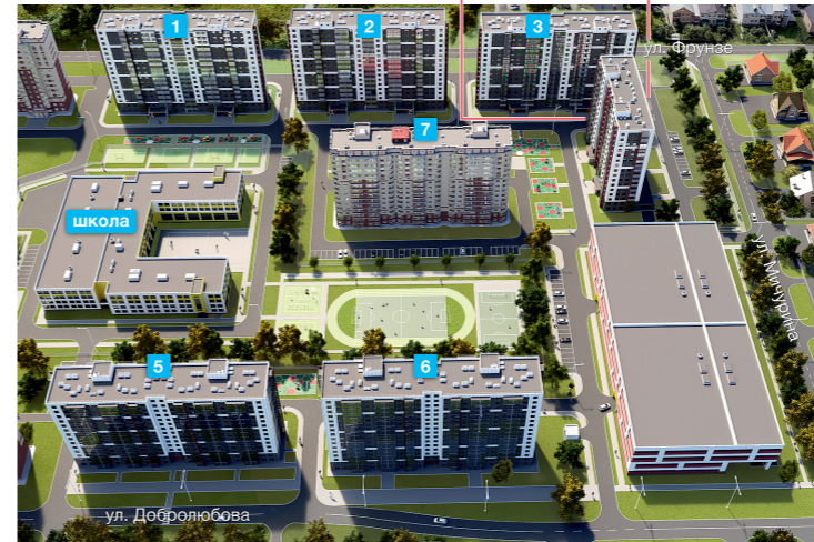
г. Щёлково • Микрорайон «Финский» ул. Фрунзе, дом 3

Благоприятная экология города и удачная локация комплекса привлекательны для семей, предпочитающих не только функциональный, но и социальный комфорт. Близость столицы и удобное транспортное сообщение, современная архитектура и высокое качество строительства и возможность для досуга в любое время года — всё это создает по-настоящему комфортную жилую среду.